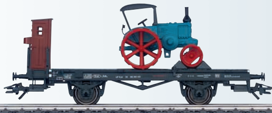
46844 Wagon plat pour Märklin H0.