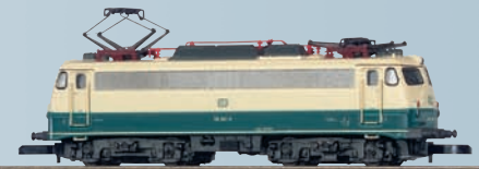
88410 Locomotive électrique pour Märklin Z.