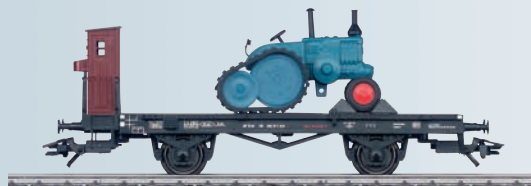
46064 Wagon plat pour Märklin H0.