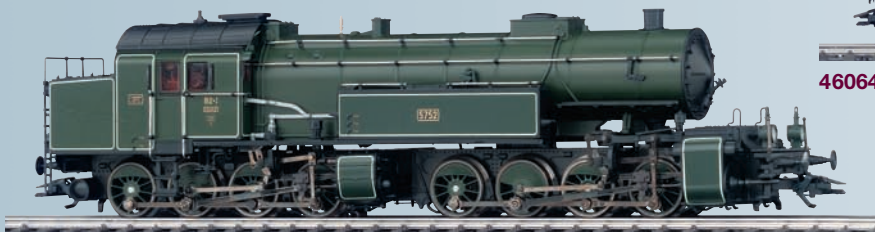
37964 Locomotive-tender pour Märklin H0.