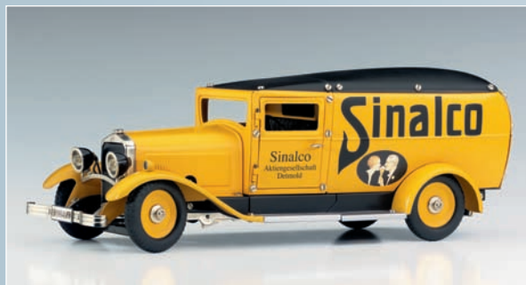
19040 Réplique d'automobile miniature pour Märklin. -Epuisé chez le fabricant-