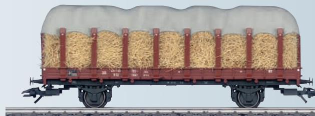
46365 Wagon à ranchers avec chargement pour Märklin H0.