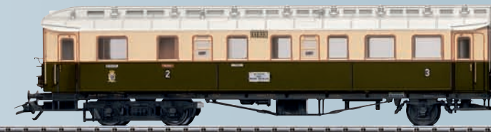
37266 Rame automotrice électrique pour Märklin H0.