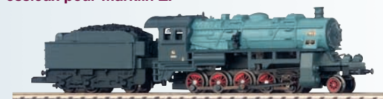
88120 Locomotive à vapeur pour Märklin Z.