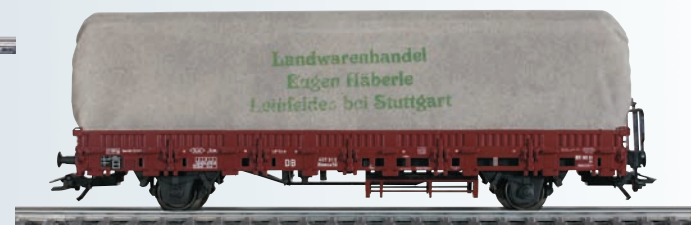
46976 Wagons à bords bas avec chargement pour Märklin H0. -Epuisé chez le fabricant-