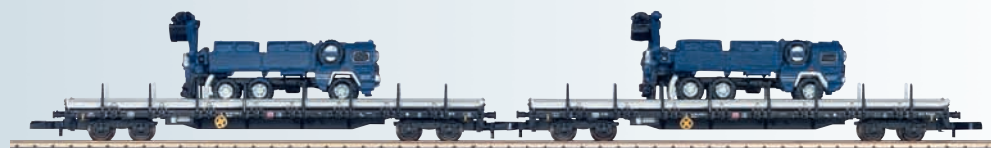
82583 Ensemble de wagons plats à quatre essieux pour Märklin Z.