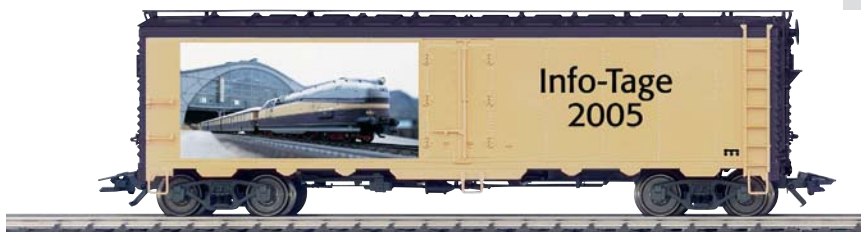
Infotag-Wagen 2005: Alle Märklin-Händler, welche Infotage veranstalten, können den Infotag-Wagen (H0) zum Veranstaltungstag bestellen. Das Angebot gilt während des Infotages jeweils solange der Vorrat reicht.

Falls keine Uhrzeit oder Mittagspause angegeben ist, erfragen Sie diese bitte direkt bei Ihrem Märklin-Händler!