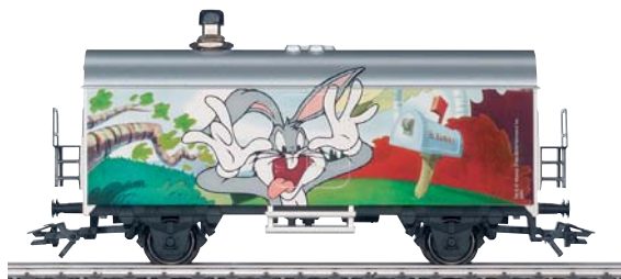
Jahreswagen 2004: Funktionswagen mit Geräuschelektronik (H0), Art.Nr. 48704