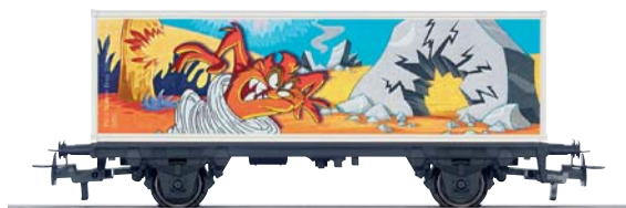
Jahreswagen 2005: Containertragwagen (H0), Art.Nr. 48705