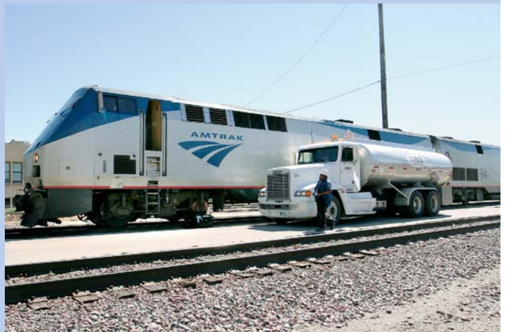
■ oben links: Der Challenger ist der »kleinere« Bruder des Big Boy. Der Zustand dieses Exemplars im »Railway & Locomotive Historical Society Museum« ist leider etwas desolat ■ oben rechts: In der alten Goldgräberstadt Silverton enden die Schienen mitten im Ort – ohne Prellbock ■ unten links: Der Zug der »Cumbres & Toltec Narrow Gauge Railway« in Lamy mit den Schatten der Fotografen ■ unten rechts: das Amtrak-Diesellokgespann des »Southwest Chief« wird in Albuquerque betankt