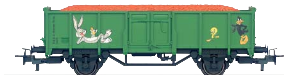
Jahreswagen 2003: Möhren-Transportwagen (H0), Art.Nr. 44242

Jedes Insider-Mitglied kann mit dem beigelegten Bestellschein über den Märklin-Fachhändler ein Exemplar bestellen. Wir weisen ausdrücklich darauf hin, dass Insider-Bestellscheine nicht übertragbar sind. Das Modell 36847 wird in einer einmaligen Serie nur für 1. FC- und Insider-Mitglieder gefertigt. Bitte beachten Sie den auf dem Bestellschein genannten Bestellschluss: 31. März 2006 Voraussichtlicher Liefertermin: Frühjahr 2006